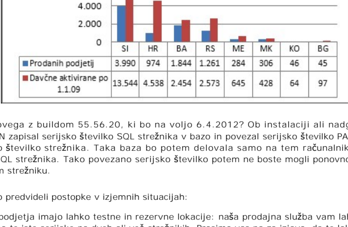
Razmerje med licenčnimi in vsemi registriranimi uporabniki. Razlika ni v celoti nelegalna, saj omogočamo legalno uporabo več davčnih številkam, v kolikor ima podjetje hčerke ali je računovodski servis.

Kaj bo novega z buildom 55.56.20, ki bo na voljo 6.4.2012? Ob instalaciji ali nadgradnji bo PANTHEON zapisal serijsko številko SQL strežnika v bazo in povezal serijsko številko PANTHEON-a s serijsko številko strežnika. Taka baza bo potem delovala samo na tem računalniku oziroma instanci SQL strežnika. Tako povezano serijsko številko potem ne boste mogli ponovno aktivirati na drugem strežniku.